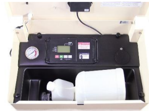
Centralina con tanica